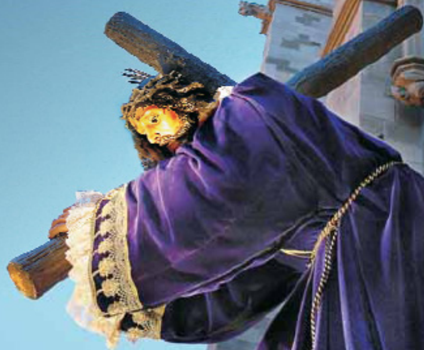
1er Premi al 2on Concurs de Fotografia · Maquetació: www.dimensiografica.com